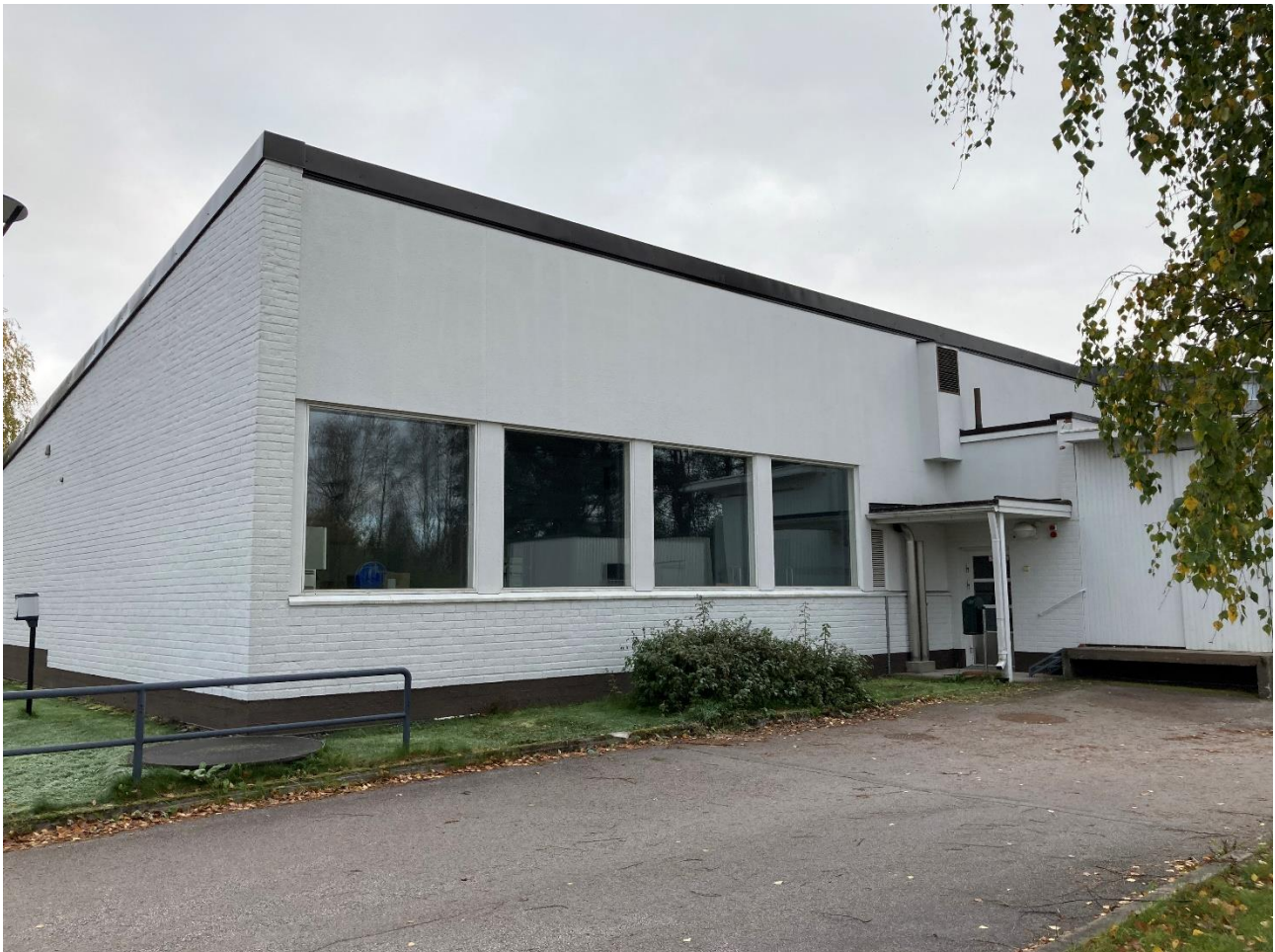
Kuva 3. Purettavaksi suunniteltu rakennus ulkoa.

Purettavaksi suunniteltu rakennus (kuvat 3 ja 4) sopii lepakoiden päiväpiilopaikaksi, sillä etenkin ullakolla on paljon rakoja ja koloja, joissa lepakot voisivat päivehtiä. Suurin osa rakennuksen sisätiloista oli kuitenkin lepakoiden lisääntymis- ja levähdyspaikaksi soveltumatonta mm. suurten ikkunoiden vuoksi hyvin valoisten huoneiden tai pintamateriaaleiltaan liukkaiden seinien (esim. laatoitetut tilat) takia. Osa soveltuvista tiloista rakennuksen sisällä sijaitti liian vaikeasti saavutettavissa lepakoiden kannalta. Purettavassa rakennuksessa ei kuitenkaan havaittu lepakoita tai merkkejä lepakoiden esiintymisestä eikä rakennus siten ole tulkittavissa lepakoiden lisääntymis- ja levähdyspaikaksi. Rakennuksen kellarikerroksesta löytyi isorotan ulostetta.