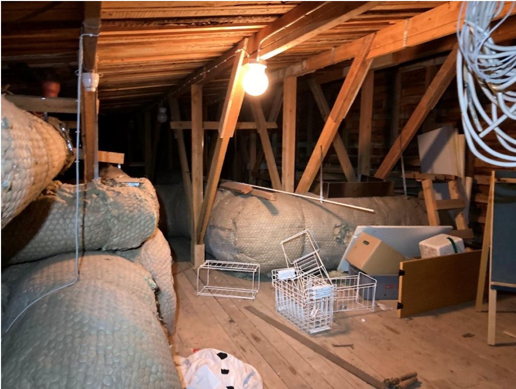
Kuva 4. Purettavaksi suunnitellun rakennuksen ullakkotila.