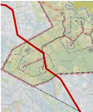
Pajukosken metsätie ja kaavaluonnos.

Pajukosken metsätie (7,4 km) yhtyy 300 m:n matkalta tuulivoimapuiston huoltotien kanssa vaihtoehdossa VE1 ja VE2. Tietä ei tulla käyttämään voimaloiden osien kuljetukseen. Tuulivoimatuotannon aikana huoltoliikenne on vähäistä.